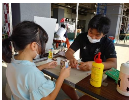
<行燈製作(布施工科高校)>

工科高校では、今後も小・中学生にもものづくりの楽しさを体験してもらう活動を続けていきます。