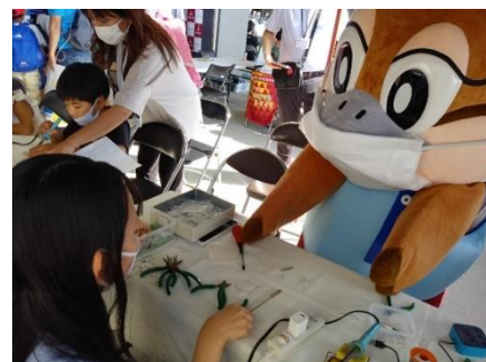
<広報担当副知事もずやんも登場!>